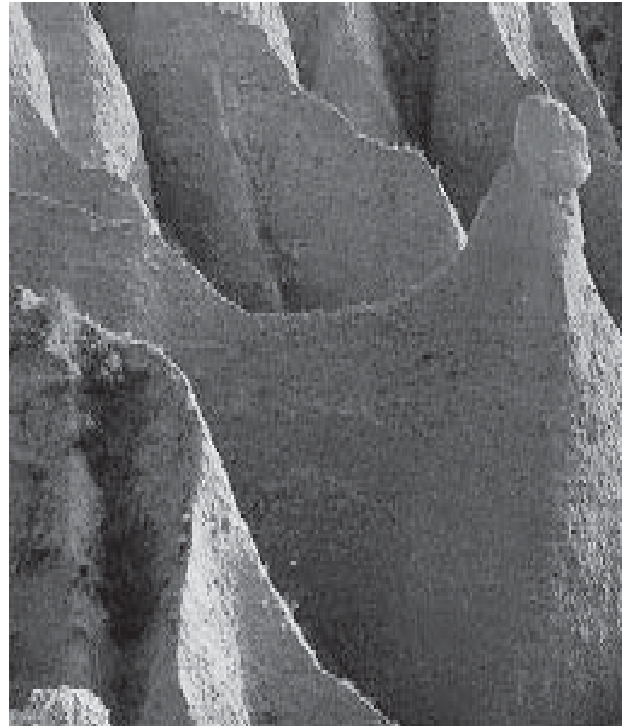
Erosión producida por la deforestación, provocada por ejemplo por la construcción de un pantano.