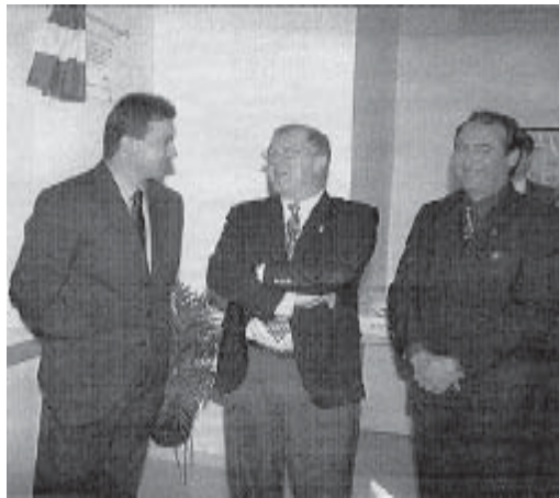
El Consejero de Salud con los Alcaldes de Fuente Palmera y Fuente Carreteros