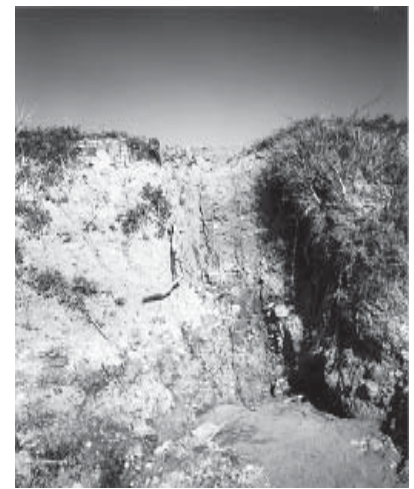
Lugar donde fueron descubiertos los restos