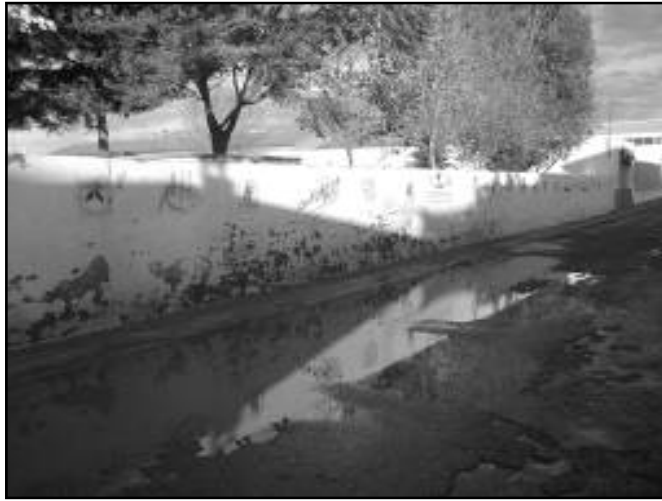
Paredes traseras del colegio García Lorca.

Y ya sobre el tema: Otro pequeño caos es la esquina de la calle Torrijos con la Laureano Pérez , gracias a la presencia del Crisbel, cosa que me parece muy bien, porque es un espacio para jóvenes y adolescentes, pero que no tienen por qué convertir la esquina en un lugar de peligro para el tráfico. No estaría de más