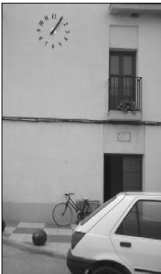
El reloj de La Ventilla.