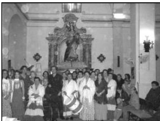
El Coro de Villalón cantó la ofrenda floral y la misa de la Inmaculada.