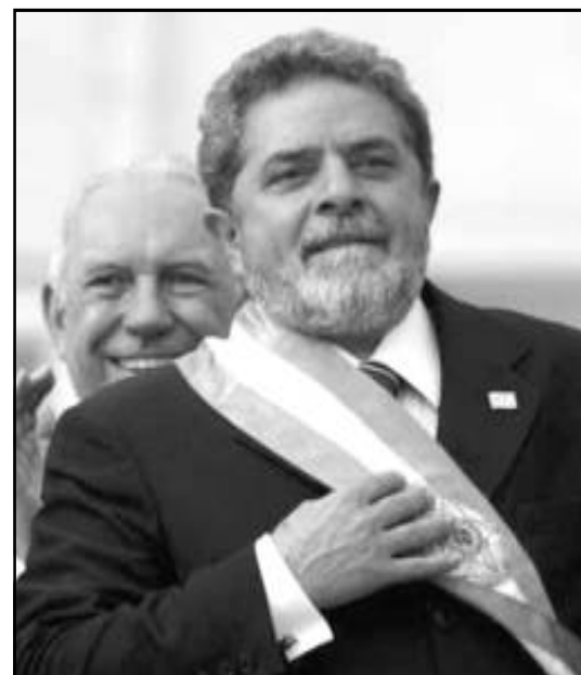
El nuevo presidente brasileño.

Pero Lula no ha prometido la revolución. Eso ha decepcionado a muchos simpatizantes de izquierda del Partido de los trabajadores (PT), sobre todo dogmáticos europeos que acusan a Lula de haberse vendido para así alcanzar el poder. Yo por mi parte creo que Lula ha actuado como quien es, como un sindicalista nato que sabe que no le interesa destruir la empresa sino arrancarle todas las mejoras posibles. La tradición revolucionaria de América Latina siempre se ha caracterizado por grandes revolucionarios que tras luchar como titanes contra las oligarquías locales y el imperialismo yanqui han acabado criando malvas e inspirando letras de canciones. Lula no quiere ser un nuevo Zapata, o un nuevo Che, y sabe muy bien que el ganar democráticamente en las urnas no garantiza que las fuerzas de la oligarquía y del imperialismo yanqui no desestabilicen el país para justificar un golpe de estado (reciente está aún el ejemplo de Salvador Allende en Chile). Por eso trata de presentar un programa calmado en el que poco a poco se cambie la situación social de su país, teniendo mucho cuidado de no levantar los fantasmas del golpismo y que Brasil quede en la memoria de todos como otro sueño que pudo ser y que no pudo ser. Un programa con objetivos modestos pero de emergencia como el garantizar que todos los