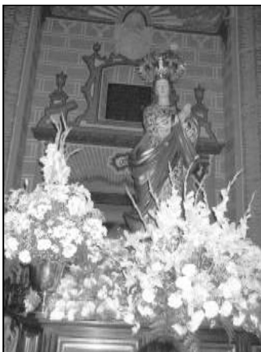
El paso de la Inmaculada durante la procesión.