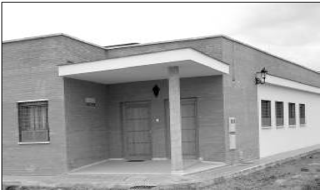
Puerta de entrada de la Guardería.