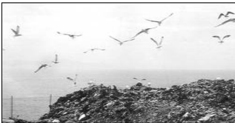
Vertedero en Galicia.

La solución sólo puede pasar por reducir la generación de basuras, aprovechar íntegramente los residuos como materias primas y frenar así el enorme crecimiento