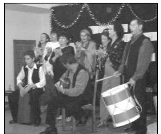
El Coro de La Ventilla durante la actuación.