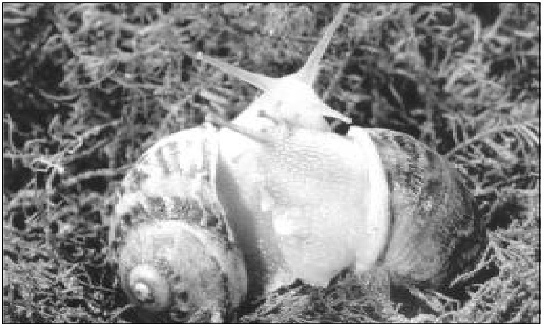
A pesar de ser hermafroditas, los caracoles también necesitan «aparearse»; claro, que la fecundación es mutua.

También determinados rituales, como el despioje y aseo del otro, tan común entre los simios, no es el mismo cuando se practica con un individuo que produce atracción sexual que con uno que despierta amistad . Muchos de estos simios distinguen muy bien