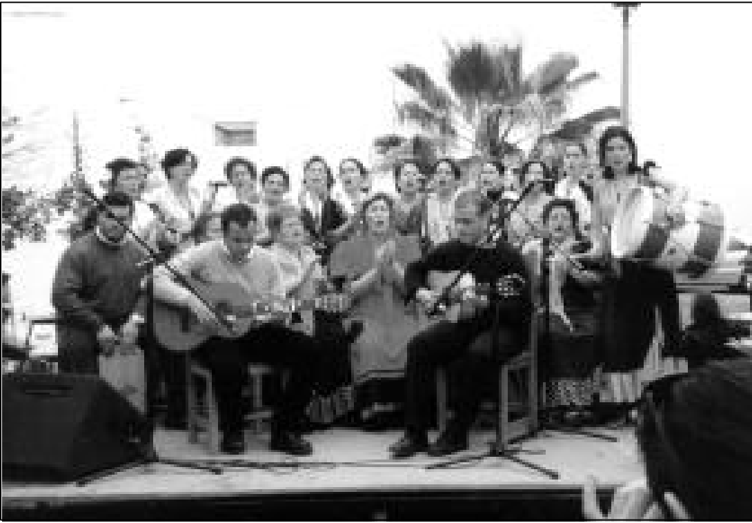
Coro de Fuente Carreteros.