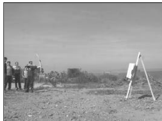
Los jóvenes de secundaria se iniciaron en el tiro con arco.

Se está trabajando para sacar nuevos programas de este tipo a través del Centro de la Mujer que pensamos que serán muy interesantes para todas las mujeres de la Colonia.