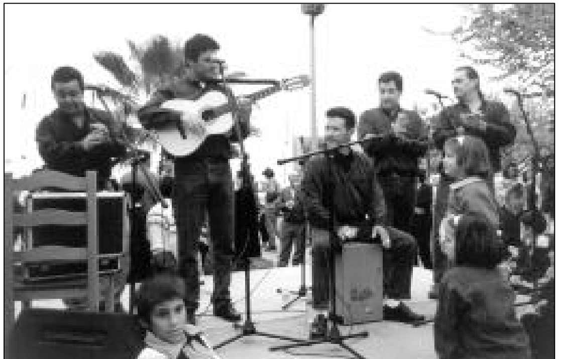
Caña y compás.