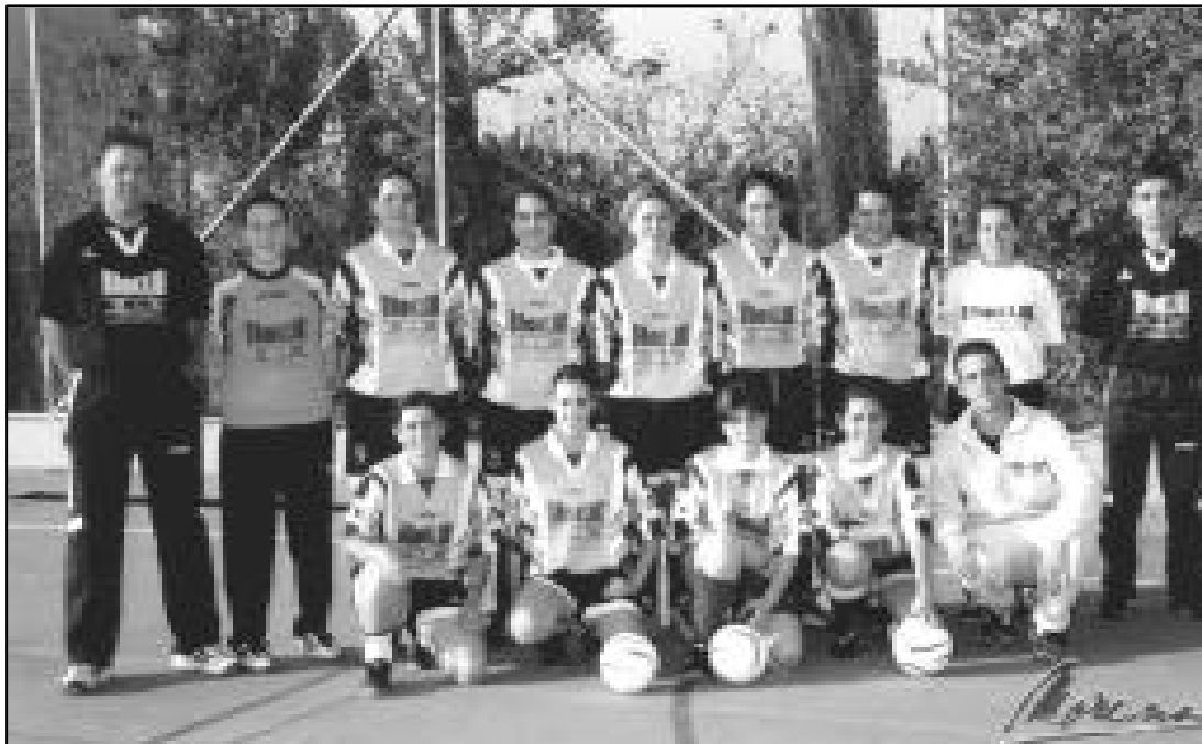
Equipo del Pub Brooklin.