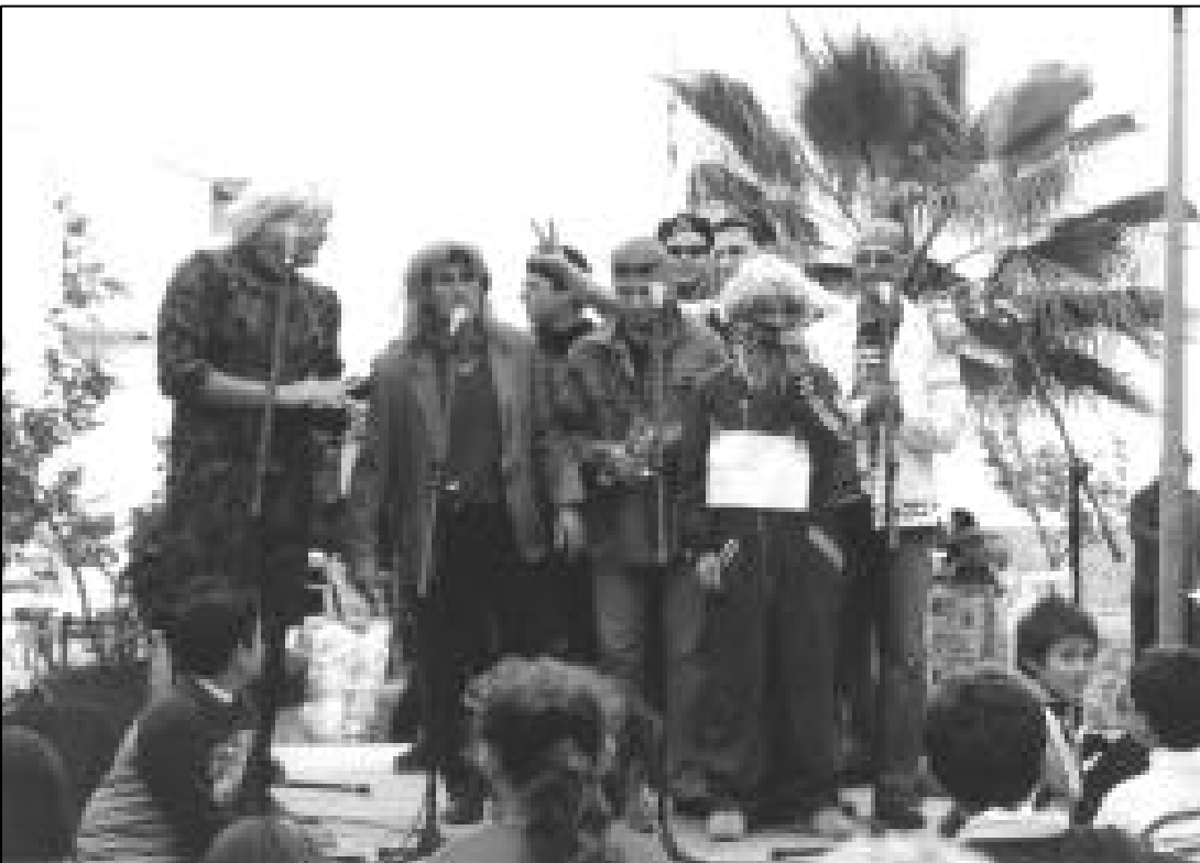
Los chulos... y una suegra con dos cozones.

El 28 de Febrero, día de Andalucía, fue celebrado por los colonos de los diferentes núcleos de población con numerosos y variados actos. Es de destacar que, en general, se está convirtiendo en un día en el que van primando las manifestaciones culturales y artísticas de nuestra gente, yendo un poco más allá del simple perol popular.