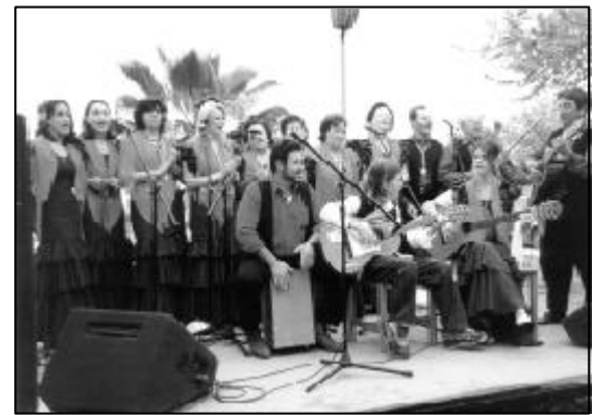
Coro de La Ventilla.