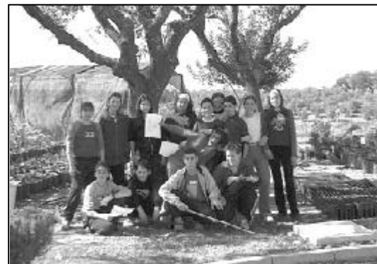
Alumnos de secundaria en la finca Los Arroyones.