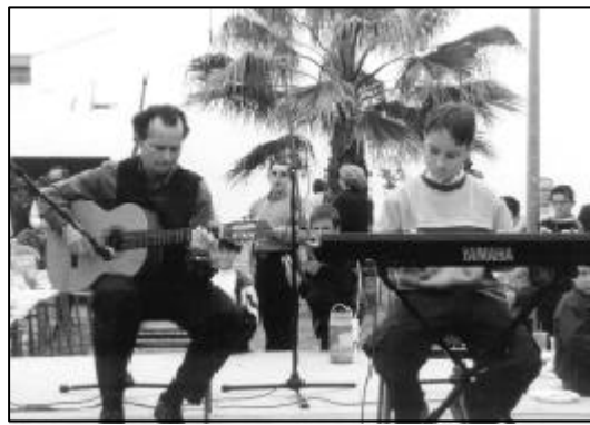
Interpretación del himno de Andalucía.