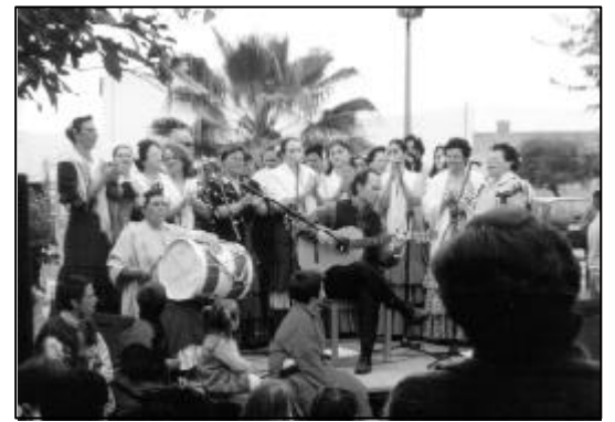
Coro de Villalón