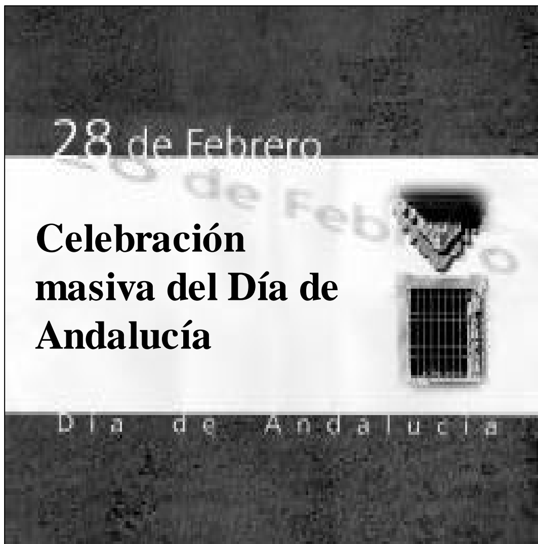
Cartel editado por la Diputación de Córdoba para celebrar el Día de Andalucía.