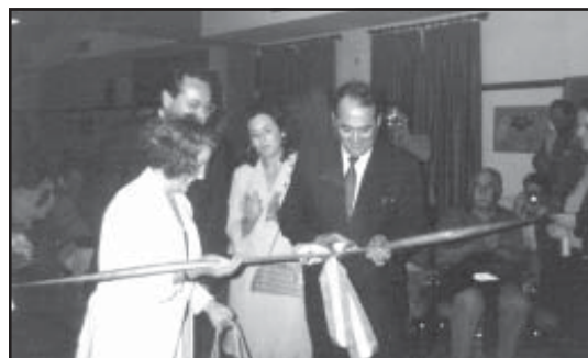
El Alcalde de la Colonia inaugurando el II Simposium de Escultura. A su derecha, la rectora de la Universidad Pablo de Olavide.