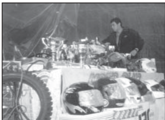
Aspecto del stand de premios.