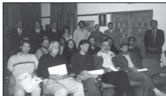
Los escultores participantes.